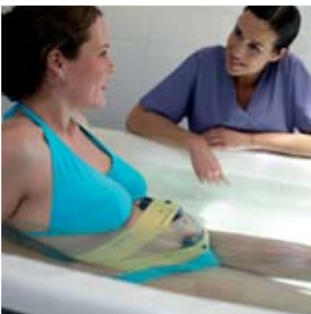
Die wasserdichten Aufnehmer sind weich und angenehm für die Patientin.

Das Avalon CTS kann nahtlos in die gesamte Produktpalette der Philips Fetalmonitore eingebunden werden und ist auch mit OB TraceVue kompatibel, dem Philips Kreißsaal-Datenmanagementsystem für alle Phasen der Geburtshilfe – von den ersten vorgeburtlichen Klinikbesuchen über die Wehen bis hin zur Entbindung, Nachsorge und Säuglingspflege.