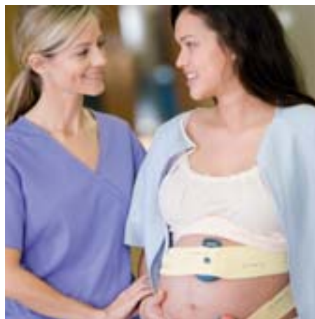
Werdende Mütter können sich in einem Umkreis von 100 m um die Basisstation des Avalon CTS frei bewegen.