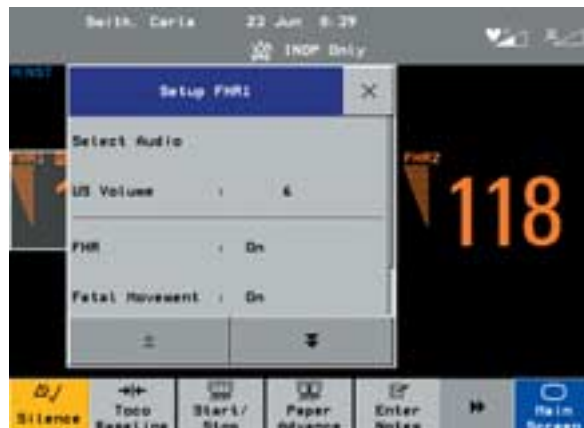
Einstellungsfenster mit Touchscreen-Bedienung und intuitiver Benutzeroberfläche.