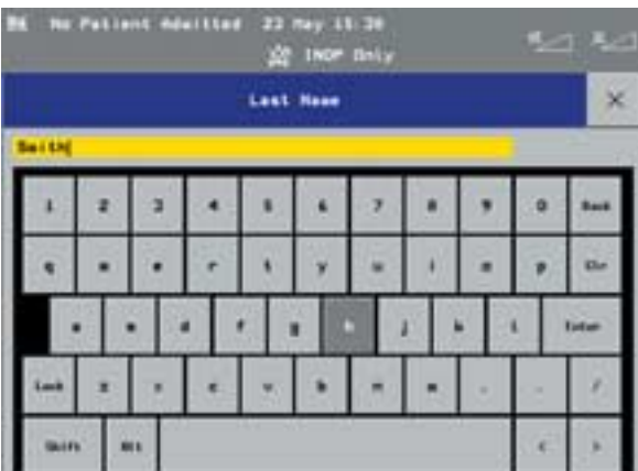
Bildschirmtastatur ermöglicht die Eingabe von Patientendaten auch ohne externe Tastatur.