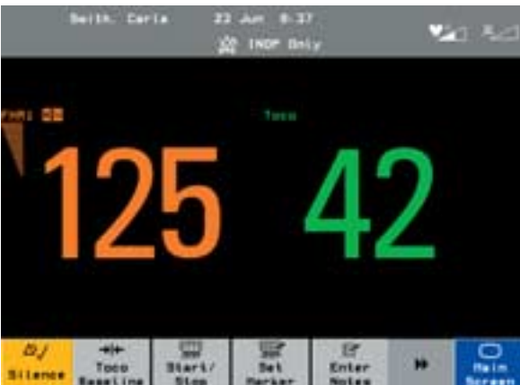
Numerische Werte werden groß und deutlich angezeigt.