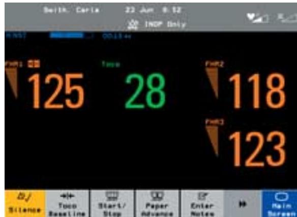
Optimale Ausnutzung der Anzeige durch automatische Bild-Layouts.