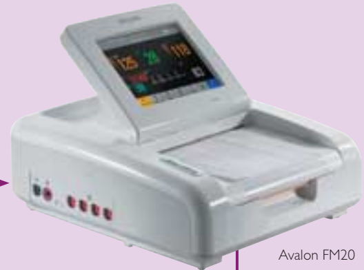
Avalon FM20 oder FM30