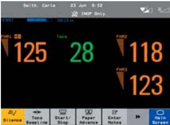
Die FM20 und FM30 Monitore ermöglichen erstmals auch die Überwachung von Drillingen.