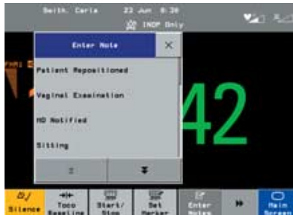
Auswahl von benutzerdefinierten Texten ermöglicht einheitliche CTG-Einträge.